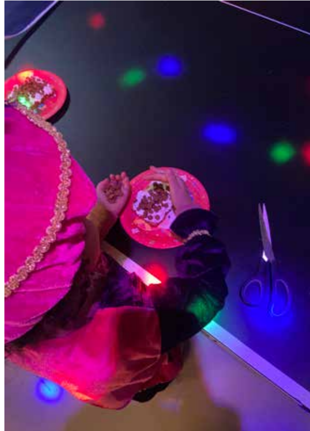
Anouk Epskamp Stagiaire kinderwerk bij Versa Welzijn

Het resultaat mocht er zijn: een verzameling prachtig versierde unieke cakejes waar alle kinderen trots op waren!