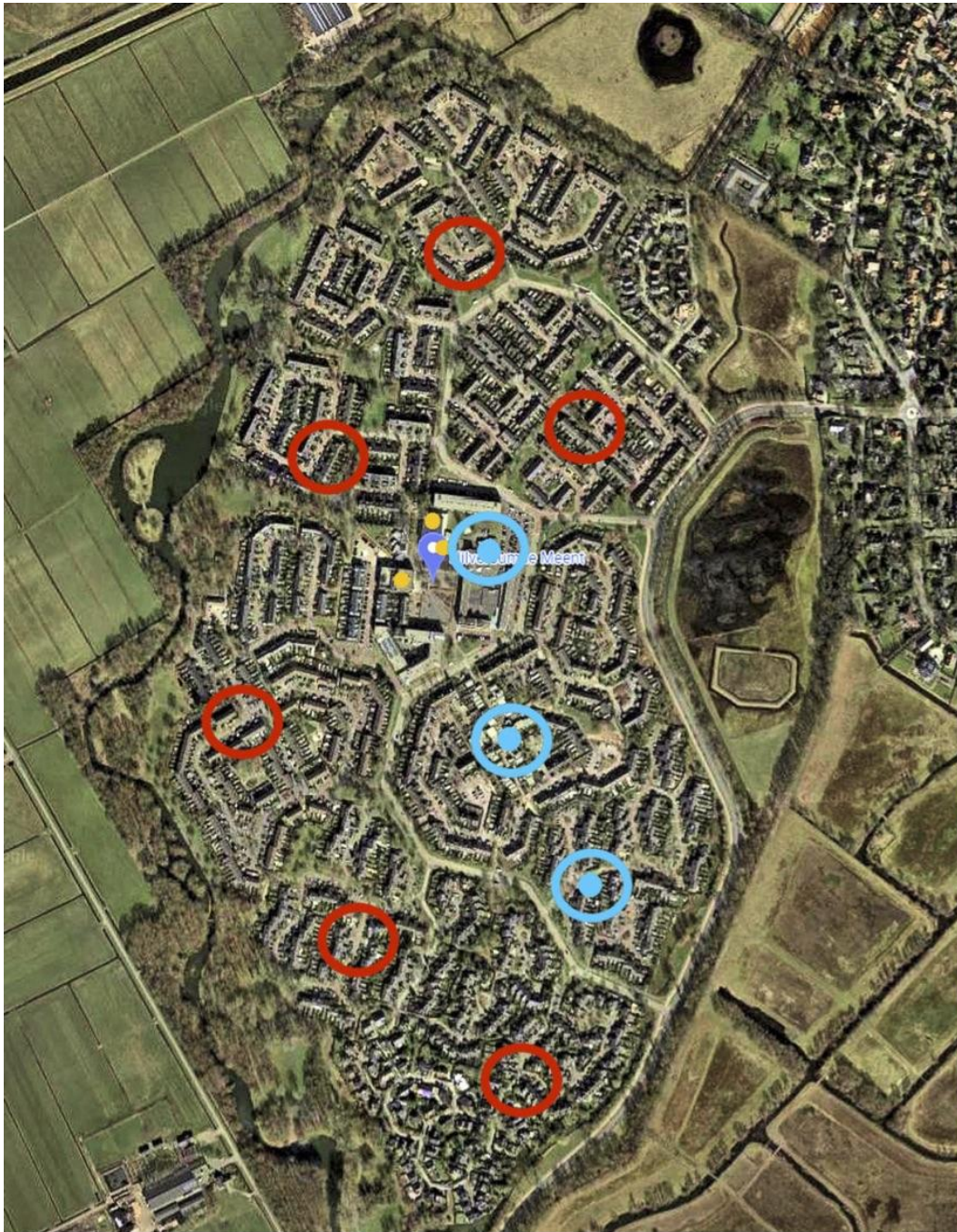
(rood) Nieuw in plan: Biezenmeent, Klavermeent, Rietmeent, Hommelmeent, Bijenmeent, Goudwespmeent, (blauw) Bestaand buiten: apotheek winkelcentrum, Krekelmeent, Wandelmeent (nú binnen, gaat naar buiten) (geel) Bestaand binnen: sporthal, wijkcentrum, scholen